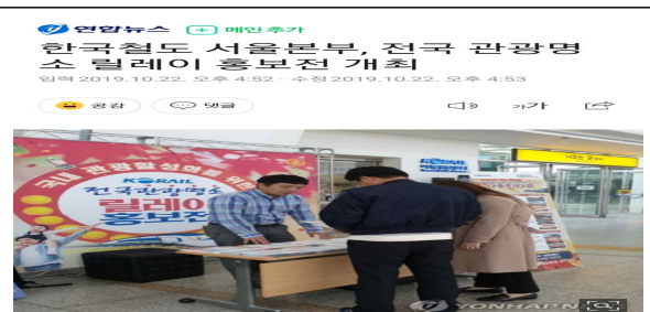
(서울=연합뉴스) 한국철도(코레일) 서울본부가 다음 달 8일까지 서울역과 용산역에서 국내 관광 활성화를 위한 전국관광명소 릴레이 홍보전을 개최한다고 22일 밝혔다.