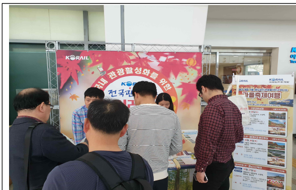
2019년도 릴레이홍보전 사진